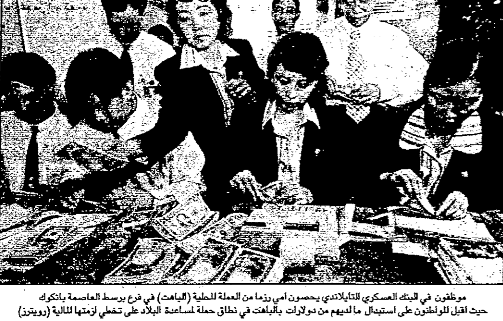
موظفون في البنك العسكري الاتحادي يبحسون امس زما من العملة المحلية (اليامات) في فرع برسد العاصمة بانكوك حيث اقبل الزائرون على استخدام ما لديهم من دولارات باليابات في نطاق حملة ساعدة البلاد على تخلي ازمته المالية